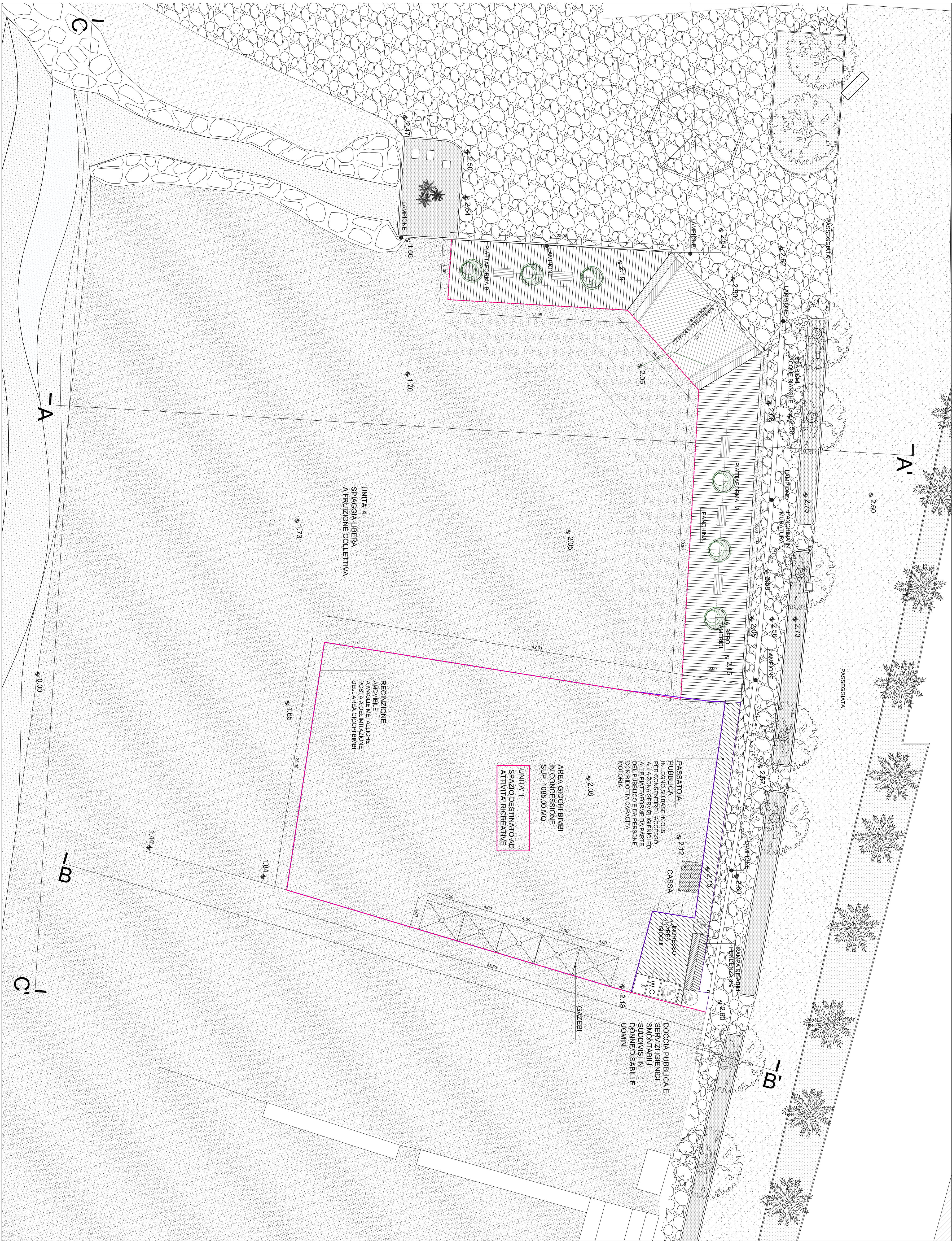
PLANIMETRIA GENERALE SC.1:200